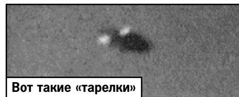
Вот такие «тарелки» летали над военными базами США в 50 - 60-е годы (вверху). Нижний снимок сделан в 2008 году над Форт Уортом.